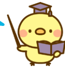
西園寺松座衛門くん

1 下のグラフは、花子さんの学校の生徒120人に聞いた、好きな果物をそれぞれ割合に表したものです